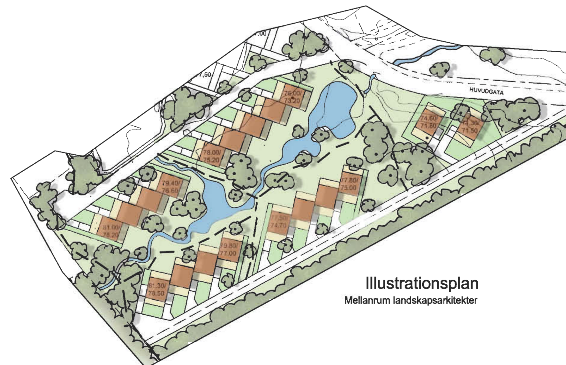
Illustrationsplan Mellanrum landskapsarkitekter