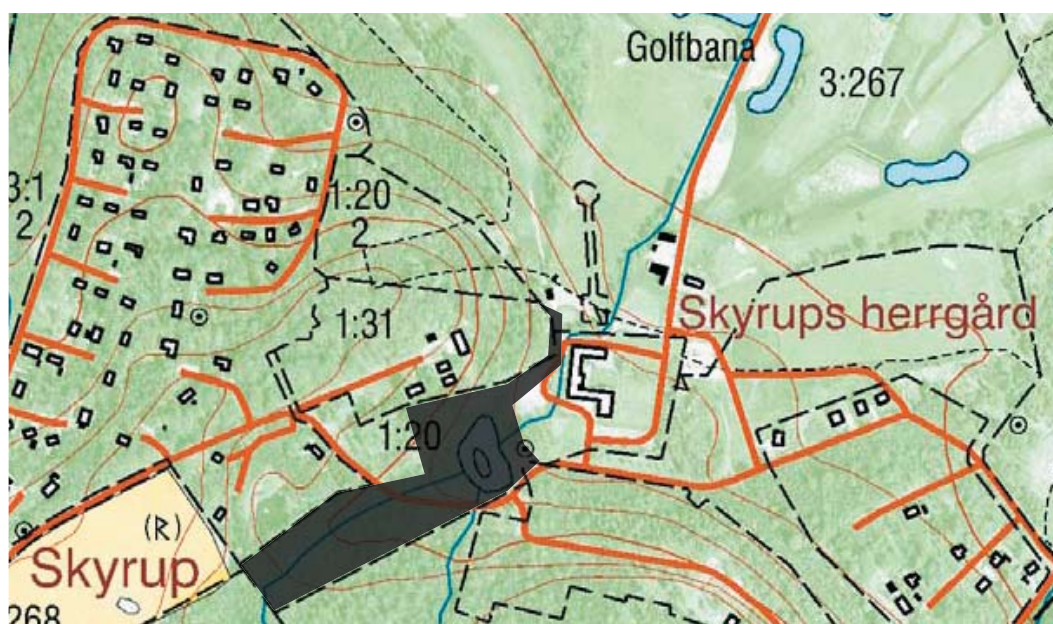
Gråskrafferat område utgör planområdet.

Planområdet omfattar den del av fastigheten Skyrup 1:20 söder om Herrgårdsvägen vilken avses exploateras för bostadsändamål, samt det område som idag utgör allmän plats enligt karta nedan. Dessutom omfattas delar av fastigheterna Skyrup 1:44, Skyrup 3:228 och Skyrup 3:1. Hela planområdet är privatägt och den totala arean är ca 3 ha.