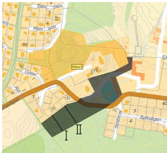
Orangemarkerat område pekas i grönplanen ut som värdefull natur. I och II markerar sektioner på sidan 5.

Något program som anger mål, förutsättningar och inriktning för denna detaljplan har inte upprättats. Detta har inte ansetts nödvändigt med tanke på att dessa aspekter istället behandlas i denna planbeskrivning som är föremål för samråd med berörda under sommaren 2006.