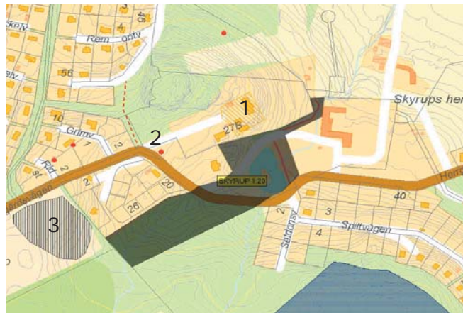
Objekt som finns upptagna i Länsstyrelsens forminnesregister.

3. Boplats utan synlig anläggning, ca 130x90 m (NV-SÖ). I åkern har påträffats ett 10-tal flintavslag. Området har status som fast fornlämning.